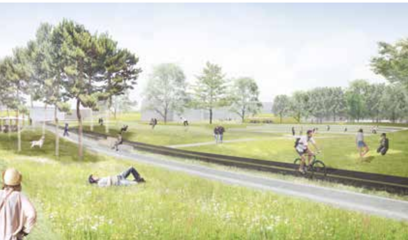
@ MAN MADE LAND