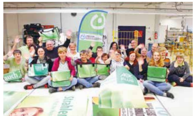
DAS COMEBAGS-TEAM IST STOLZ AUF SEINE PRODUKTE.